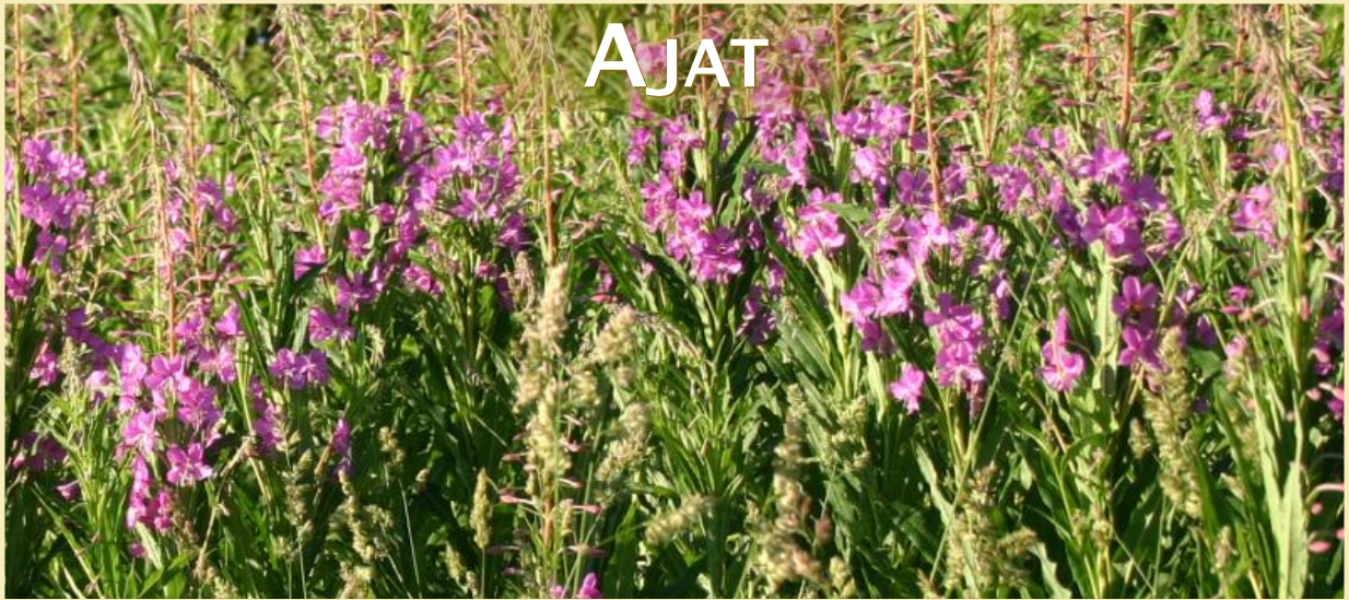
Epilobium angustifolium, rentun ruusu, maitohorsma