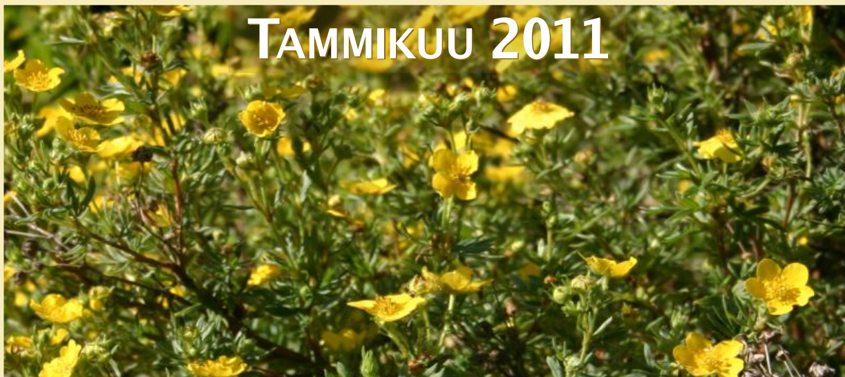
Potentilla fruticosa, pensashanhikki