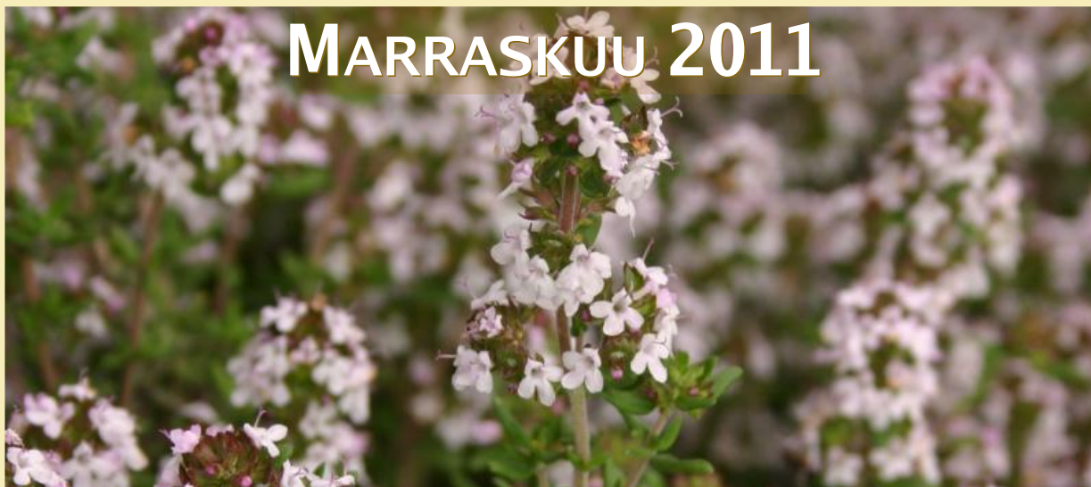
Thymus vulgaris, tarha-ajuruoho