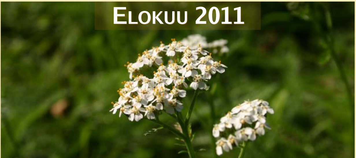
Achillea millefolium, siankärsämö