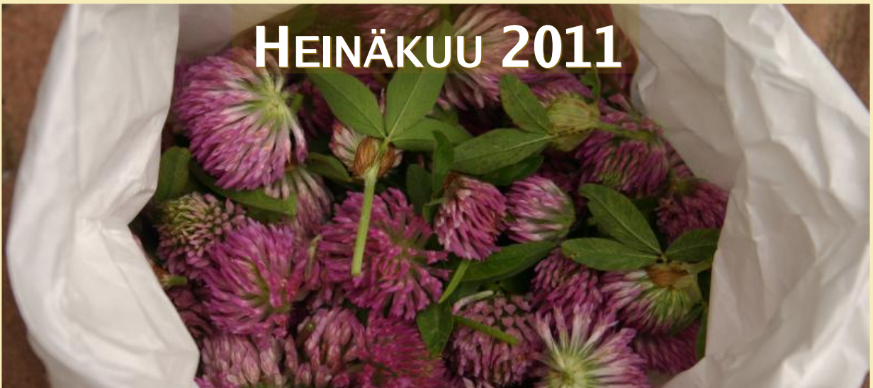
Trifolium pratense, puna-apila