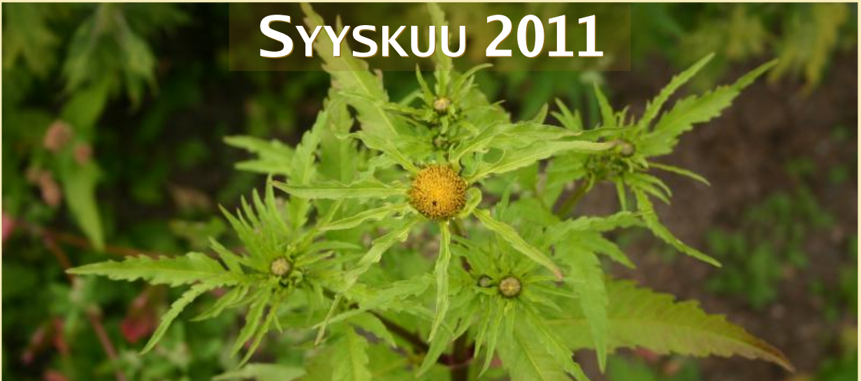
Bidens radiata , säderusokki