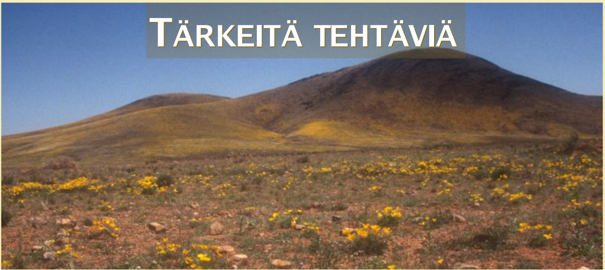
Eschscholzia californica , tuliunikko