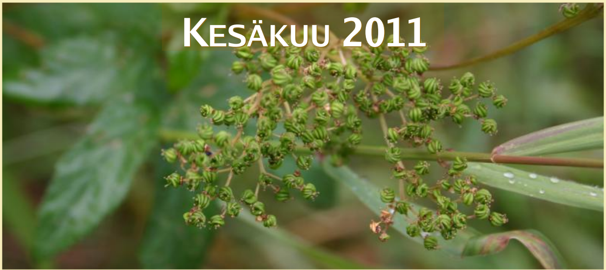
Filipendula ulmaria, mesiangervo