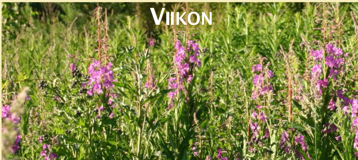
Epilobium angustifolium , maitohorsma, rentun ruusu