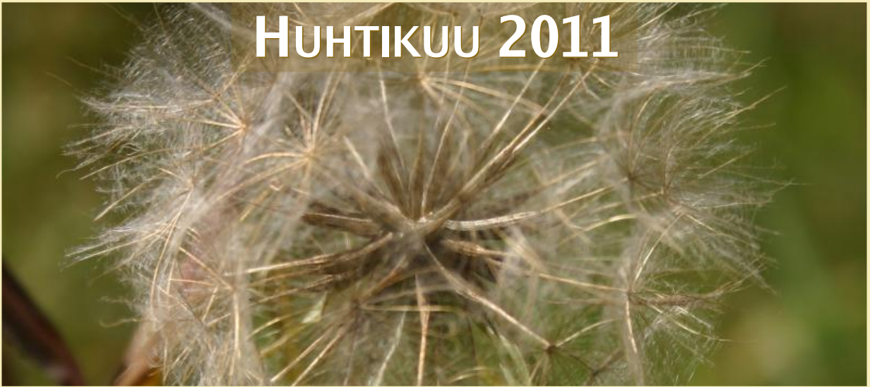
Tragopogon pratensis, pukinparta