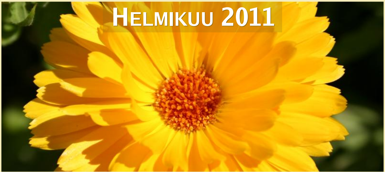
Calendula officinalis, kehäkukka