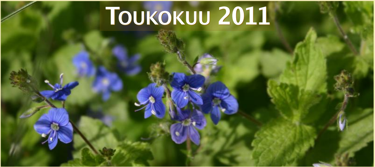
Veronica chamaedrys, nurmitädyke